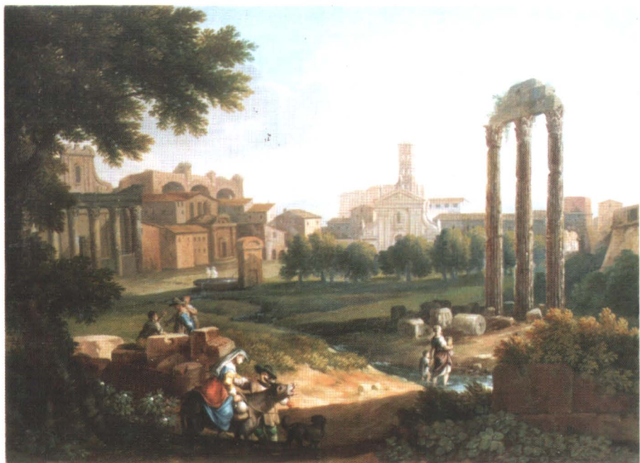
17. PAOLO ANESI (1697 - 1773)

Un asemenea peisaj cu un bogat repertoriu arheologic antic este Vedere din Roma veche cu coloanele templului lui Jupiter Stator (fig.17), atribuit în mod eronat la începutul veacului XX pictorului