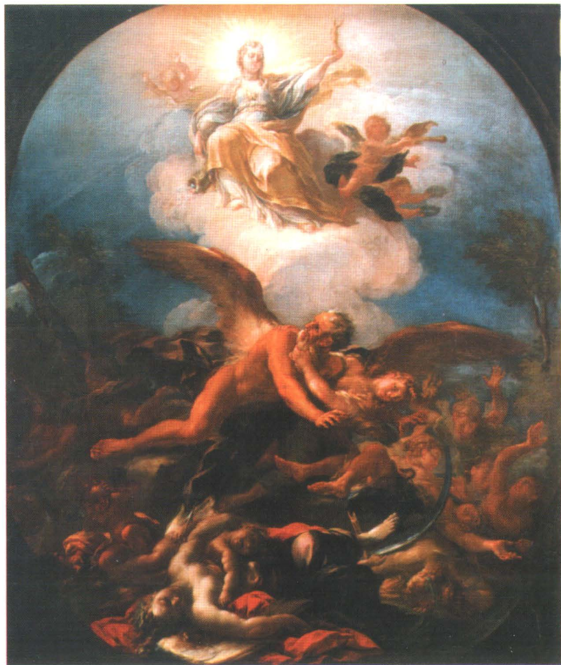
15. GIACOMO DEL PO (1652 - 1726) Triumful bisericii asupra păgânismului

În aceeași sferă a picturii baroce cu un pronunțat caracter alegoric se înscrie și opera unui important artist al școlii napolitane, Giacomo del Po (1652 - 1726), intitulată Triumful bisericii asupra păgânismului (fig.15).