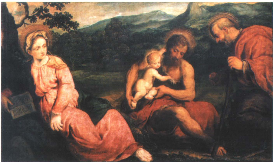
3. PARIS BORDONE (1500 - 1571) Sfânta Familie