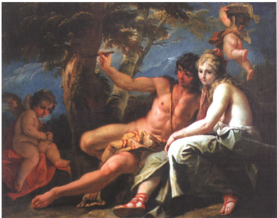
6. SEBASTIANO RICCI (1659 - 1734)