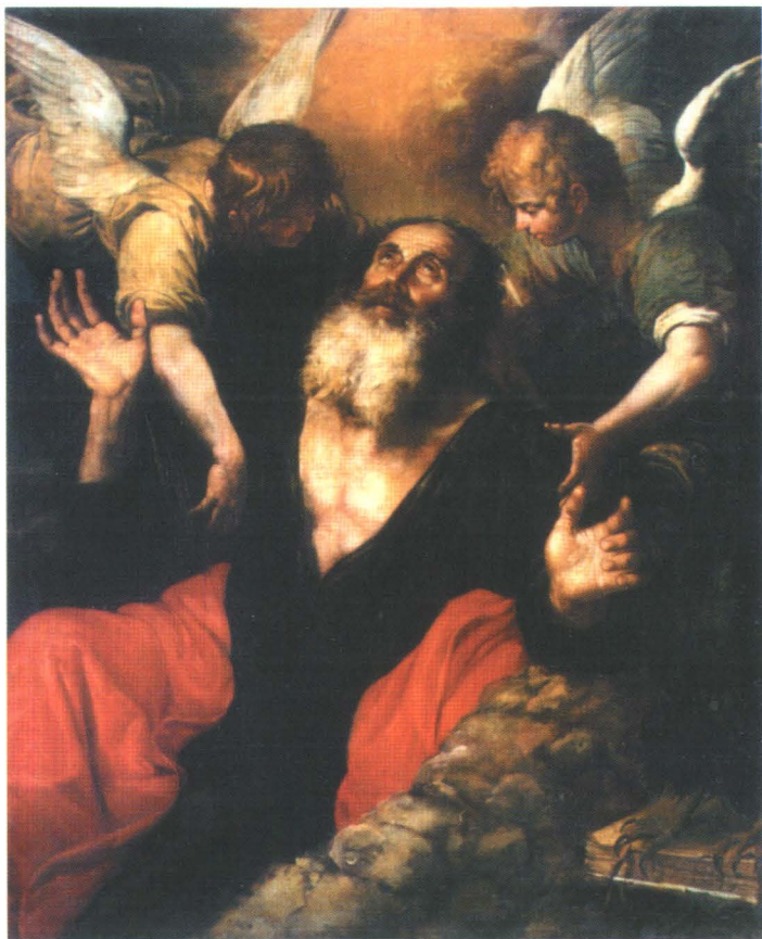
11. DOMENICO FIASELLA (IL SARZANA) (1589 - 1669)

Domenico Fiasella (1589 - 1669), apreciat lider al picturii genoveze de Seicento, în anii de tinerețe (primele două decenii ale lui Seicento) activează la Roma unde va deprinde limbajul clasic al romaniștilor, fiind totodată receptiv la influența marelui Caravaggio, influență care în deceniile trei și patru se va manifesta prin dominarea unei maniere din ce în ce mai naturaliste, relevată și de lucrarea sa din colecția sibiană, Sfântul Ioan din Patmos ( Revelația Sfântului Ioan ) (fig. 11).