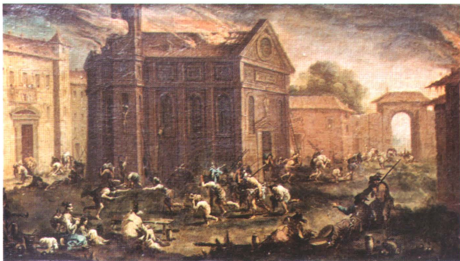
12. ALESSANDRO MAGNASCO zis LISSANDRINO (1667 - 1749)