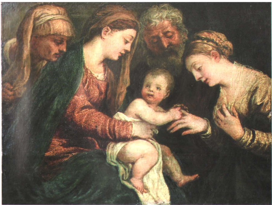
2. LAMBERTO SUSTRIS sau ZUSTRIS (1515 cca. - 1584 cca.) Logodna mistică a Sfintei Ecaterina