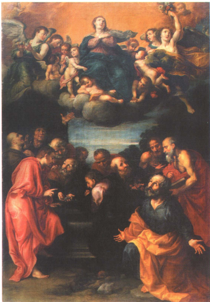
8. DENIS CALVAERT zis DIONISIO FIAMMINGO (1540 - 1619)

Pictorul olandez Denis Calvaert, prezent în Pinacoteca Brukenthal cu o amplă compoziție, Înălțarea Mariei (fig.8), se stabilește de tânăr la Bologna, unde-și va deschide un atelier propriu prin care vor trece o pleiadă de învățăcei, între care și tinerii din familia Carracci, frații Annibale și Agostino împreună cu vărul lor Lodovico. Pictorii Carracci vor înființa la rândul lor celebra academie de artă intitulată „ Accademia degli