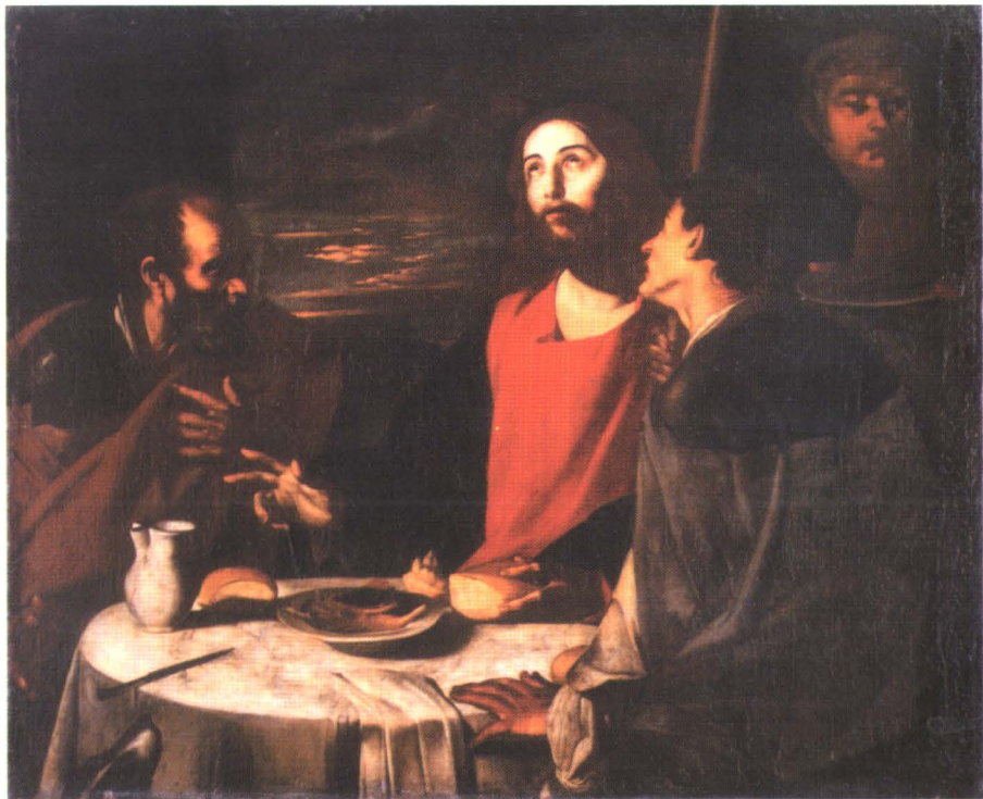
16. MASSIMO STANZIONE (1585 - 1656)

Un alt pictor napoletan, nobilul Massimo Stanzione (1565 - 1656), unul din cei mai importanți artiști din orașul de la poalele Vezuviului, a creat o operă bogată, influențată de Caravaggio, inspirată mai cu seamă din Noul Testament. O importantă lucrare de a sa, Cina din Emaus (fig.16), este emblematică pentru maniera lui Stanzione. Deși