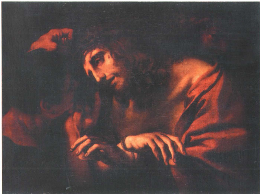
9. ANNIBALE CARRACCI (1560 - 1609)

Cel mai apreciat pictor al familiei Carracci , Annibale (1560 - 1609) este ilustrat cu o importantă operă, intitulată Batjocorirea lui Cristos (fig.9), replică autografă de un deosebit rafinament, apreciată de experții italieni, ce ne-au vizitat muzeul, ca fiind la fel de valoroasă cu originalul aflat în Pinacoteca Nazionale din Bologna.