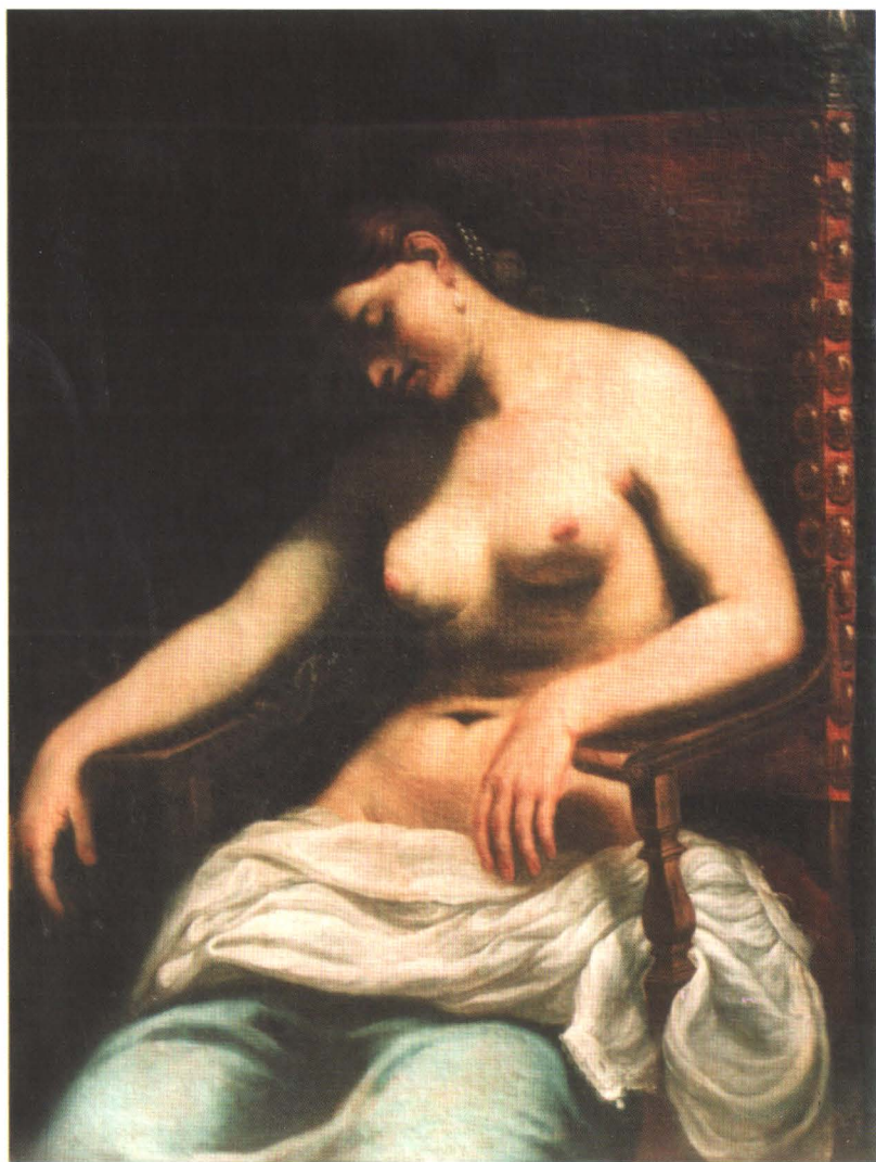
10. GUIDO CAGNACCI (1601 - 1663) Moartea Cleopatrei

Kunsthistorisches Museum din Viena. Având același titlu cu lucrarea noastră, ce o reprezintă murind pe Cleopatra, singură în jilțul său regal, opera de la Viena redă momentul dramatic al morții aceleiași regine, într-o compunere scenografică, înconjurată de mai multe sclave. Concluzia ce s-a impus din această analogie, a fost aceea, că Moartea Cleopatrei de la Sibiu este un original de Cagnaccci ce reprezintă fie studiul pentru