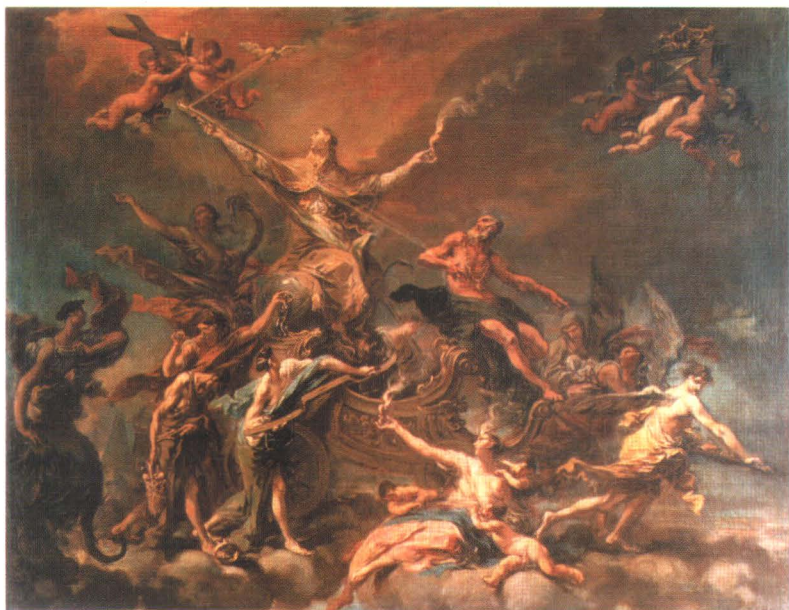
14. ALESSANDRO MAGNASCO zis LISSANDRINO (1667 - 1749) Triumful Credinței (Triumful Binelui)