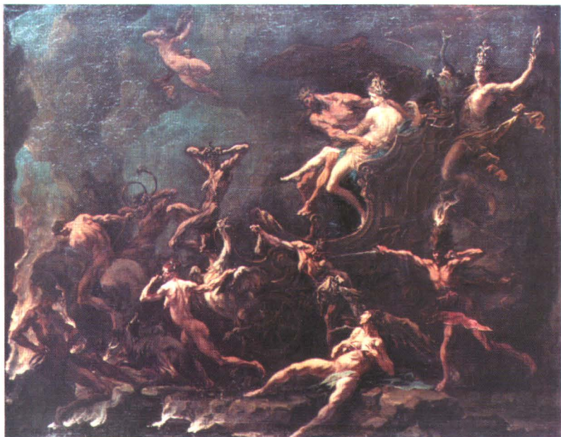
13. ALESSANDRO MAGNASCO zis LISSANDRINO (1667 - 1749) Răpirea Proserpinei (Triumful Răului)